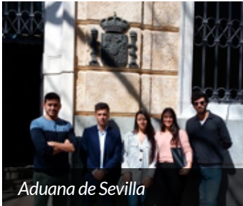
Aduana de Sevilla