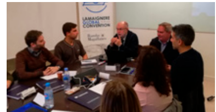
Director Territorial de Andalucía ICEX