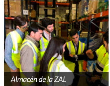
Almacén de la ZAL