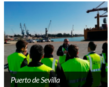
Puerto de Sevilla