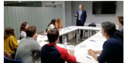
Prestigioso Bufete Abogados ADVOCARE